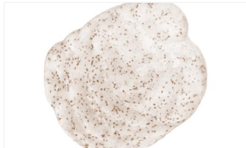
병풀잎 원물이 함유된 젤 클렌저로 수분감 가득한 제형이 특징입니다.