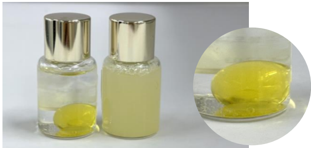
오일볼이 아래쪽에 위치하며 흔들어 사용 후 다시 볼 형태로 뭉쳐집니다.