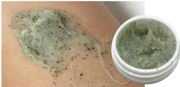
팩처럼 도포 후 부드럽게 롤링하여 모공과 피지까지 케어할 수 있습니다.