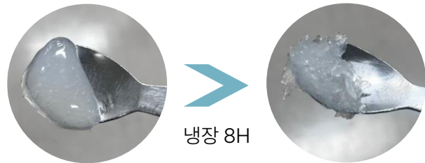
냉장 시 샷벳 제형으로 변하며 얼음 결정을 형성하여 더욱 시원한 쿨링 효과 선사