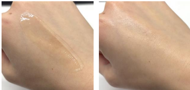
젤 텍스처가 건조한 피부를 수분으로 잡아주고 푸석거리지 않는 피부로 가꿔줍니다.